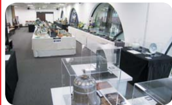
大盛況だった「臥牛窯の展示即売会」の様子

熊本市上通町のホテルオークス2階に位置する「オークスホール」。ご希望の予算や利用時間に応じて、空間をお客さまだけのプランでお楽しみください。